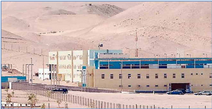
Establecimiento Penitenciario de Alto Hospicio