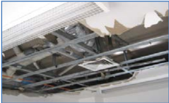
Se detectan acciones destructivas en Unidad de Salud, por interno al obstruir ductos de evacuación

Filtración en Módulo 45-48, sector Guardia de Módulo: se detecta una filtración de agua potable en el sector de la Guardia de Módulo, lo que llevó a la SC BAS a romper la losa de Radier, para encontrar el punto de filtración.