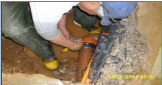
Reparación de filtración en Red Húmeda Módulos 31-32.

Se realiza mantención en Caniles: Eliminación de óxido y pintura a estructuras metálicas de Caniles.