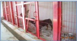
Mantención de Caniles.

Mantención Equipamiento de Seguridad: Se mantiene la instrucción respecto de la reparación ni reposición por parte de la SC de la totalidad de los equipos que no se encuentran operativos.