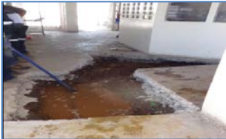
Se detecta filtración de Agua Potable en Agrupación 45-48, sector Guardia de Módulo.

Dentro de las mantenciones, la SC instaló cámara PTZ en Área 14 Galpón 4 – Panadería, luego de retirar cámara domo e instalarla en Patio Módulo 12, restableciendo nuevamente el sistema en dicho sector. Aún quedan pendientes la instalación de cuatro cámaras domo.