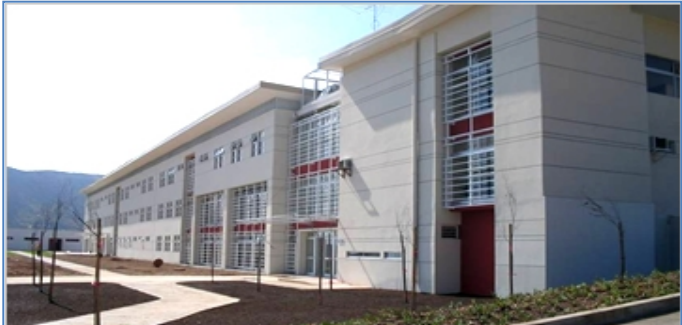
Establecimiento Penitenciario de La Serena

De acuerdo al DS N° 271 del 13.09.13 se modifican las capacidades máximas de los Establecimientos Penitenciarios a un 140%