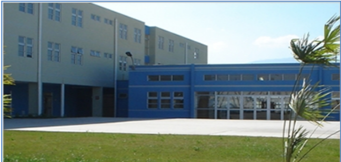
Establecimiento Penitenciario de Rancagua